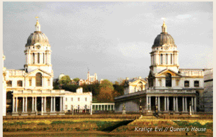
Kraliçe Evi // Queen's House

The Museum's websites received 4,088,861 visits (2,627,520 in 2003) compared to a Funding Agreement target of 2,000,000.