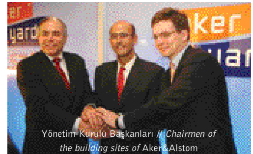
Yönetim Kurulu Başkanları // Chairmen of the building sites of Aker & Alstom

As of December 2005, with 14 newbuilding orders, Fincantieri shipyard group claimed to have about 50% of all orders on hand for cruise ships in their orderbooks. Aker Finnyards has three vessels, corresponding to a 17% market share. Then there are now the four ships (16%) from Chantiers de l'Atlantique. Meyer Werft has orders for six vessels (17%). Last November, Alstom Marine was commissioned by MSC Cruises to build two cruise ships each with 1,650 cabins.