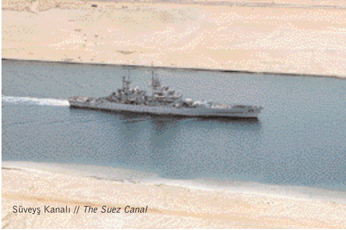
Süveyş Kanalı // The Suez Canal