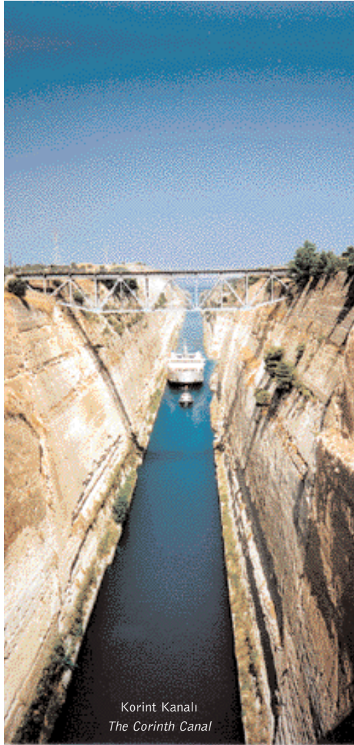
Korint Kanalı The Corinth Canal

Kanalın yönü 131,5 veya 311,5 derecedir ve Korint Kistağı ile keşşerek düz bir hat oluşturur. Kıstak deniz seviyesinden maksimum 79 metre yüksekliğe erişen engebeli kara kitlesini keser. Korint Kistağını ikiye bölen Kanal 6,343m uzunluğundadır, bu uzunluğun 540 metresi Kanalın her iki ucunda bulunan Poseidonia ve Isthmia limanlarındadır. Kanalın deniz seviyesindeki minimum genişliği 24,6 metre ve 8 metre derinliğindeki taban genişliği 21 metredir.