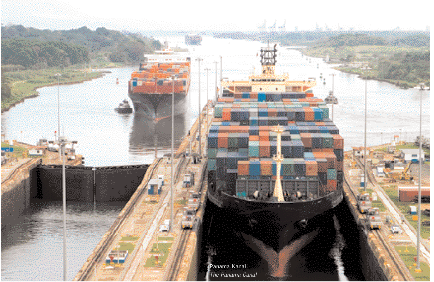
Panama Kanalı The Panama Canal

Kanalın seyir için güvenli olan deniz seviyesindeki ve ortalama düşük su seviyesindeki maksimum genişliği 24,60 metredir. Kanaldan geçen gemilerin maksimum yüksekliği (air draft) tren ve karayolu köprülerinden ötürü 52m ile sınırlıdır.